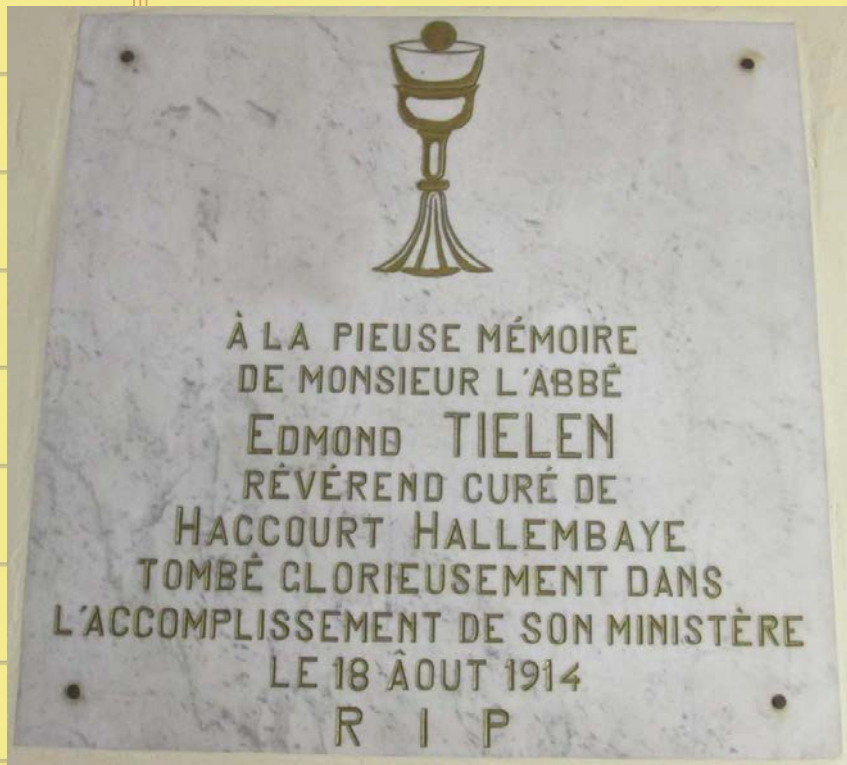
Pierre tombale à la chapelle de Hallembaye (Haccourt), groupe arrêté à Blegny et panneau explicatif à Hermalle-sous-Argenteau.